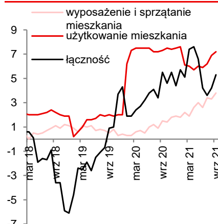
Inflacja CPI, wybrane kategorie, % r/r